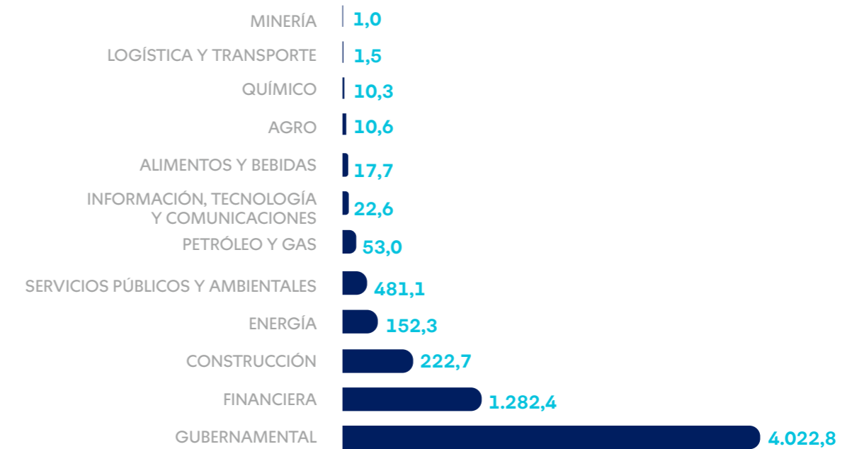
EXPOSICIÓN SECTORIAL DE PORTAFOLIOS DE INVERSIÓN DE SURAMERICANA (EN USD MILES DE MILLONES)