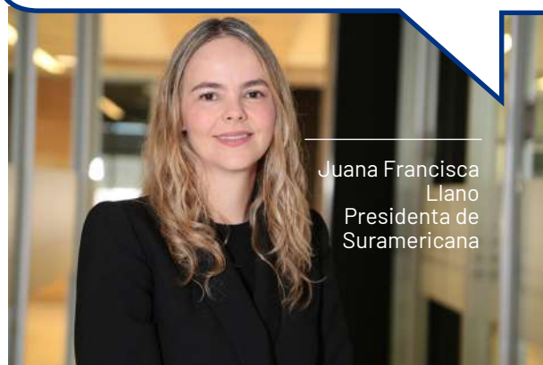
Juana Francisca Llano Presidenta de Suramericana

"Estos resultados reflejan los esfuerzos por fidelizar a nuestros clientes desde tres frentes: transformación del modelo operativo; desarrollo de nuevas soluciones y reconversión de otras, para responder a las condiciones actuales de las personas y las empresas en la región; al tiempo que fortalecemos nuestros accesos y canales."