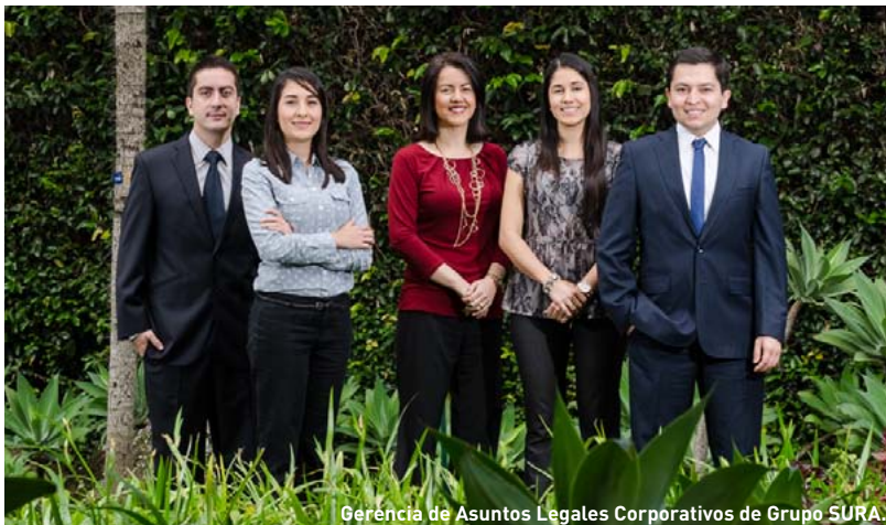
Gerencia de Asuntos Legales Corporativos de Grupo SURA.

En el marco del International General Counsels Awards que se llevó a cabo en Nueva York, el grupo editorial francés Leaders League , que reúne a algunas de las publicaciones más importantes en temas legales y financieros de Europa, reconoció al área legal de Grupo SURA, como uno de los Mejores Departamentos Legales de América Latina, otorgando una distinción especial y el premio en la Categoría Plata.